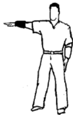
Waza-Ari 1 punt